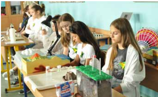
Uczniowie prezentowali ciekawe doświadczenia