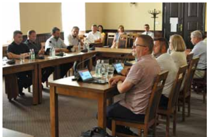
Uczestnicy sesji Rady Gminy Bestwina

1. Gmina otrzymała kolejne promesy z programu „Polski Łód” – na termomodernizację budynku OSP w Bestwinie i na remont ul. Mirowskiej w Kaniowie. Obecnie trwa przygotowywanie przetargów i aktualizowania kosztorysów na te zadania. Oczekuje się na rozstrzygnięcie kolejnych wniosków: według zapowiedzi ministra Pawła Szefernakera ma odbyć się to w najbliższych dniach – gmina Bestwina złożyła wniosek na remont ul. Granicznej w Janowicach. 2. Realizowane są dwa duże projekty: budowa sali gimnastycznej przy szkole w Janowicach i przebudowa chodnika przy ul. Witosa w Bestwinie. 3. Złożono wniosek do Programu Rozwoju Obszarów Wiejskich, dotyczący budowy kanalizacji w rejonie przysiółka Ochmanowiec w Kaniowie (PROW dofinansowuje do 5 mln. zł. w sołectwach będących poza aglomeracją). 6. Po podjęciu uchwały budżetowej będzie możliwe ogłoszenie przetargu na kanalizację w rejonie ul. św. Sebastiana w Bestwinie. 7. Odbyły się przetargi na modernizację placówek oświatowych w ramach „Dostępnej Szkoły”. W Bestwinie gmina jest na etapie wyboru