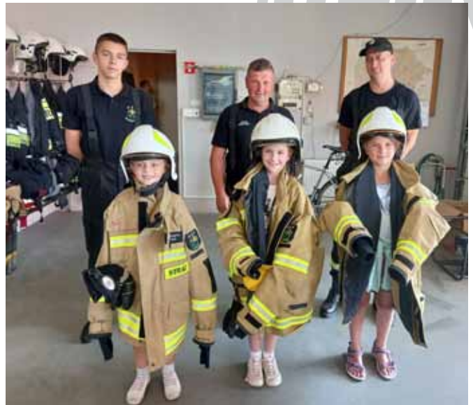
Odwiedziny u strażaków