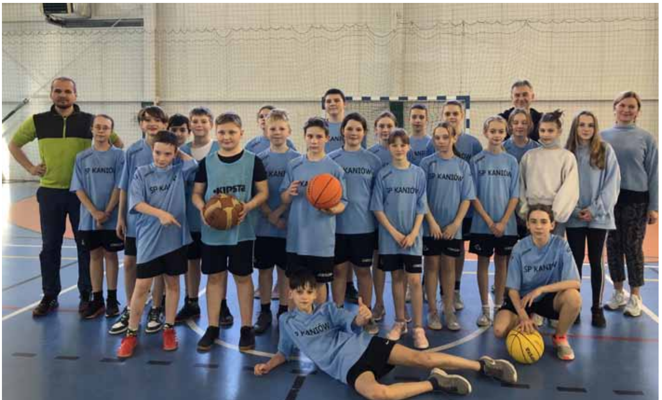
Reprezentacja szkoły w Kaniowie