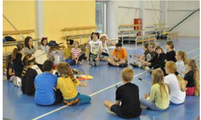
Zajęcia etnograficzne – ludy Ameryki Północnej