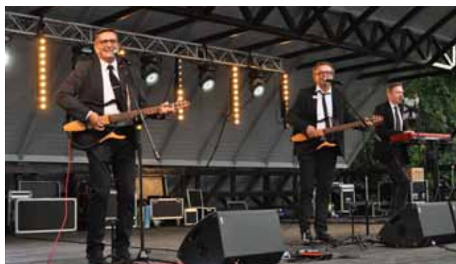
Występ kabaretu OT.TO