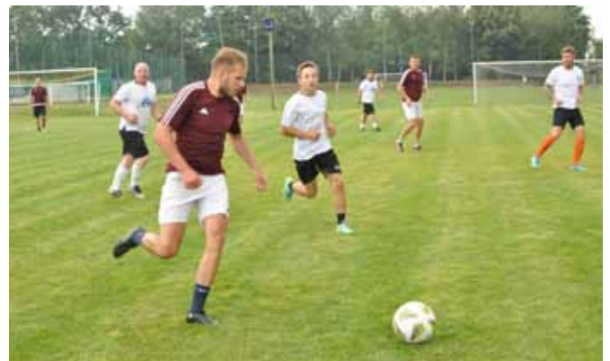
Jedno z rozgrywanych w Kaniowie spotkań