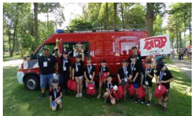
Ekipa MDP Janowice