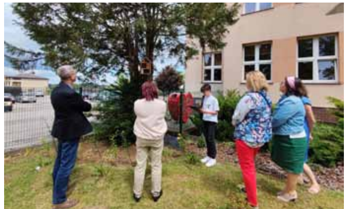
Wizyta w szkolnym ogrodzie