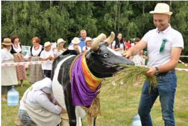
Widowiskowe dojenie krowy