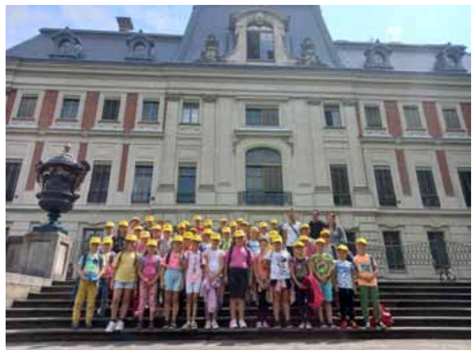
Wycieczka do pałacu w Pszczynie