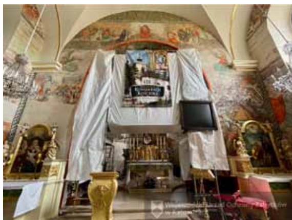
Renesansowe polichromie w bestwińskim kościele

Wojewódzki Urząd Ochrony Zabytków w Katowicach poinformował na swoim profilu społecznościowym że w kościele Wniebowzięcia NMP w Bestwinie trwają wieloetapowe prace konserwatorskie przy odkrytej polichromii prezbiterium (prace w nawie zostały już zakończone).