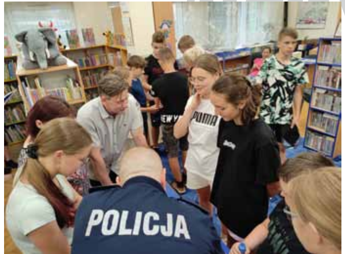
Noc Detektywów – zajęcia w bibliotece

Najważniejszym punktem wieczoru była jednak gra terenowa, której ostatecznym celem było odnalezienie skarbu żony ostatniego cesarza z dynastii Ming. Młodzi detektywi zostali podzieleni na trzy grupy, a potem długo mierzyl się z przeróż-