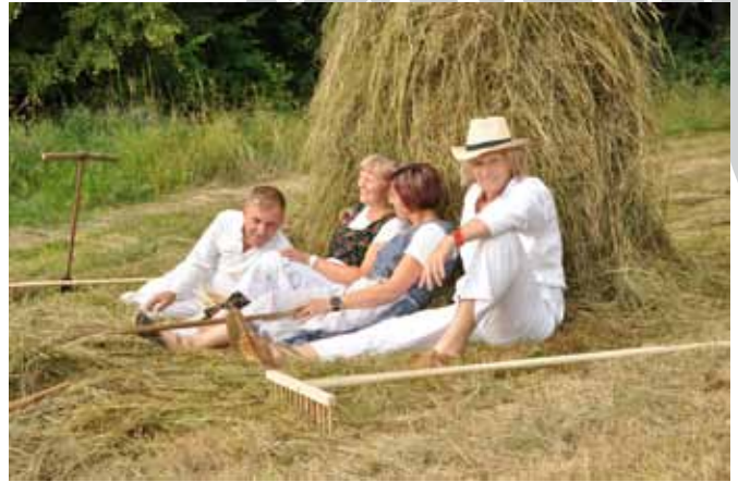
Po ciężkiej pracy należy się odpoczynek