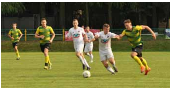
Mecz LKS „Przełom” Kaniów – LKS Bestwina