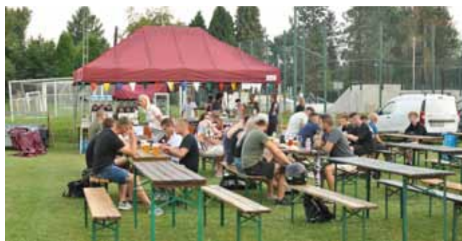
Zaplecze gastronomiczne festynu