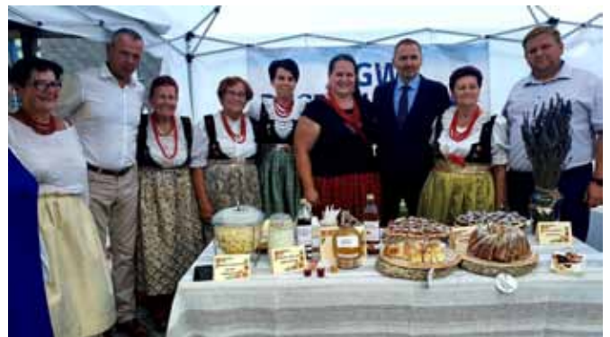
Stoisko KGW „Bestwinianki”