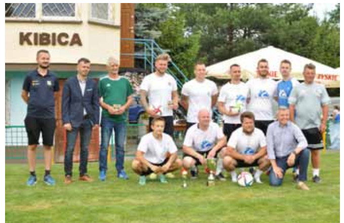
Puchar dla zwycięzców ufundował poseł Przemysław Drabek