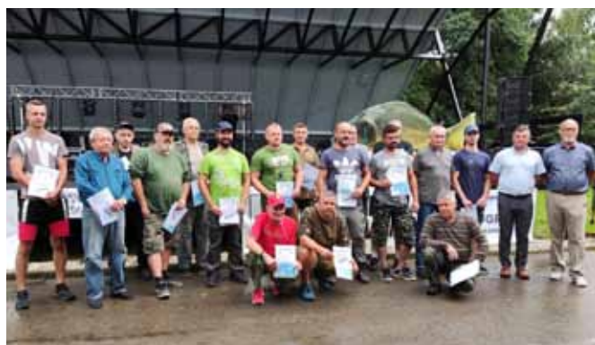
Podsumowanie zawodów wędkarskich

W przerwie pomiędzy występami odbyła się część oficjalna – w jej trakcie zwycięzcy zawodów wędkarskich otrzymali z rąk wójta i sołtysa piękne statuetki w kształcie ryby. Władze Stowarzyszenia „Kaniowski Karp Królewski” postanowiły również na-