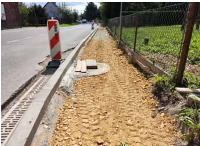
Budowa chodnika przy ul. Witosa