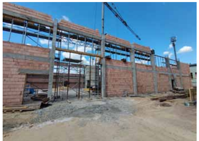
Budowa sali gimnastycznej w Janowicach