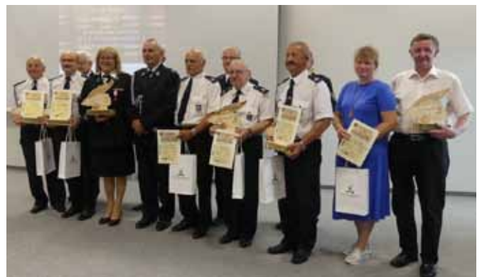
Autorzy nagrodzonych kronik OSP

także fotokronikę OSP Bujaków, kronikę prowadzoną przez Młodzieżową Drużynę Pożarniczą w Grodźcu, kronikę prowadzoną przez zespół regionalny przy OSP Jaworze i publikację wydaną przez OSP Pisarzowice. Komisja podkreśliła wysoki i wyrównany poziom prowadzonych kronik oraz wyjątkowo cierpliwą i twórczą pracę kronikarzy.