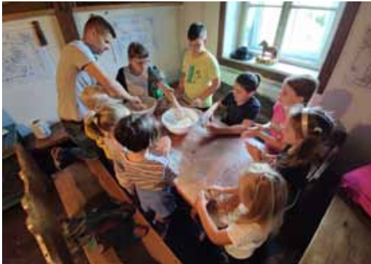
Warsztaty kulinarne – tradycyjne pieczywo

Na stronie internetowej powiatu bielskiego możemy znaleźć pokaźną listę twórców i artystów ludowych, mistrzów malarstwa, rzeźby, haftu i rzemiosła artystycznego. Są między nimi również osoby związane z gminą Bestwina. Każdy z tych pasjonatów w pewnym momencie rozpoczął swoją przygodę z tworzeniem, niektórzy już w dzieciństwie. Być może w ich ślady pójdą uczestnicy warsztatów „Na ludowo”, jakie w dniach 27 – 29 lipca odbywały się w Muzeum Regionalnym im. ks. Zygmunta Bubaka.