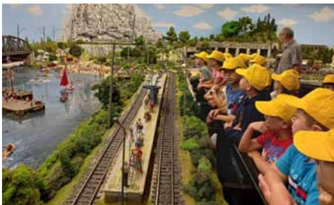
„Kolejkowo” w Gliwicach