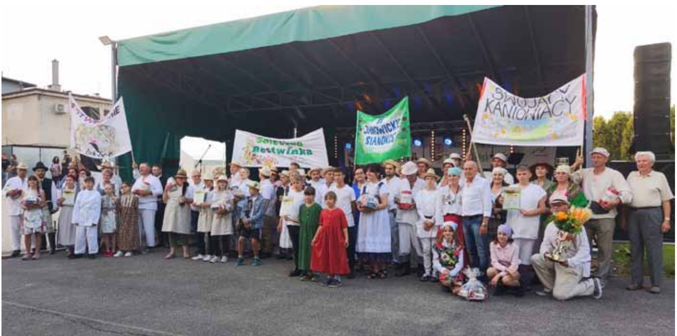
III Janowickie Sianokosy – reprezentacje sołectw

Zabawa zabawą, lecz zwycięzcę wyłonić trzeba, toteż w konkurencjach zawodnicy dali z siebie wszystko, nie oszczędzając rąk i nóg. „Dyscypliny sportu” związane ściśle z życiem na