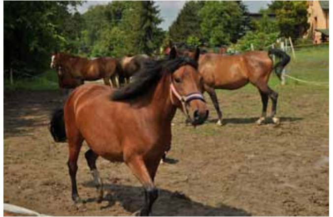
Piękne i szczęśliwe konie z Janowic

Część gospodarcza to przede wszystkim stajnia, gdzie