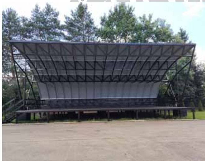
Odnowiona estrada w Kaniowie