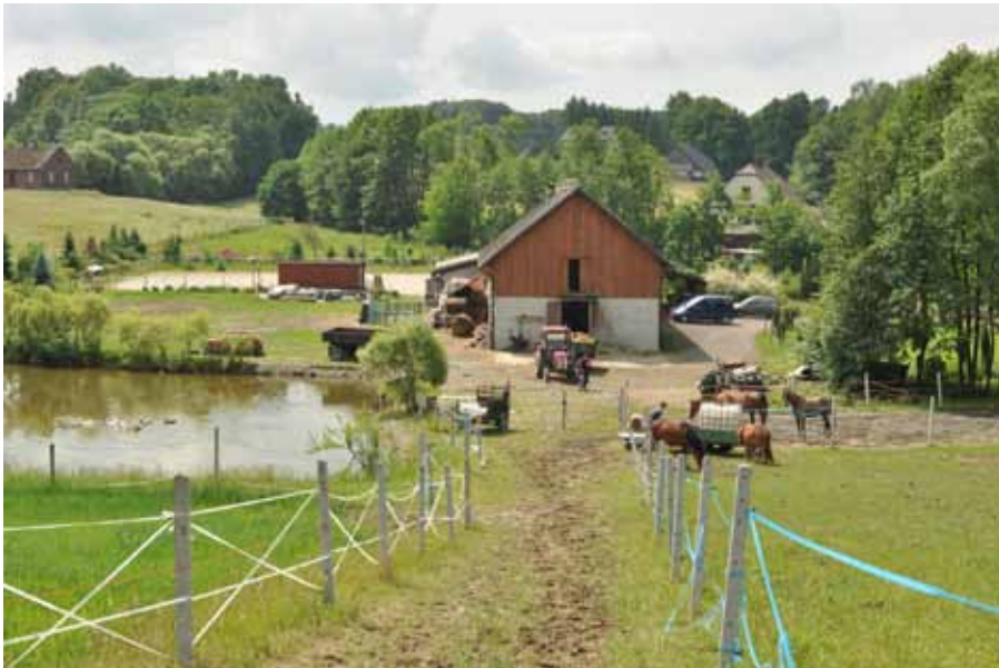
Widok na stadninę