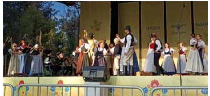
Występ w Oświęcimiu

Jak co roku Regionalny Zespół Pieśni i Tańca „Bestwina” brał udział w Tygodniu Kultury Beskidzkiej. W tegorocznej, 59 edycji, udział wzięło około 90 zespołów folklorystycznych, w tym 11 zagranicznych. Zespół „Bestwina zaprezentował” publiczności tradycyjny lachowski program wokalnie taneczny z obszaru pogórza beskidzkiego. Na dwóch estradach w Szczyrku i w Oświęcimiu widzowie podziwiać mogli nasze tradycyjne pieśni i tańce: śmia-