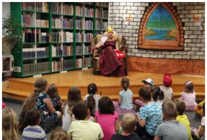
Teatryki cieszyły się wielkim zainteresowaniem